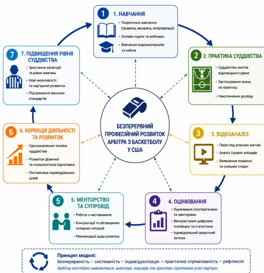
Рис. 2. Модель безперервного професійного розвитку арбітра з баскетболу у США

Такий підхід сприяє швидшій адаптації до професійної діяльності та формуванню професійної ідентичності арбітра.