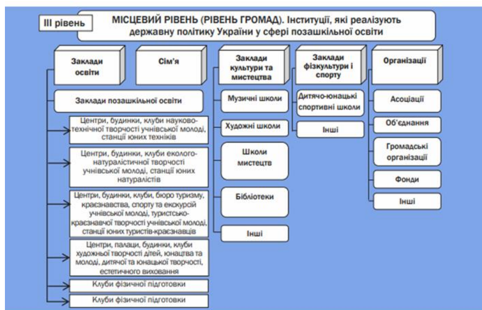
Рис. 1. Система позашкільної освіти в Україні на місцевому рівні (Биковська, 2018)

Метою Стратегії розвитку позашкільної освіти в Україні є підвищення якості і доступності позашкільної освіти, розширення функцій закладу позашкільної освіти в адміністративно-територіальній одиниці як центру освітньої, соціокультурної та громадянської діяльності з урахуванням навчання впродовж життя (Биковська, 2018). Закон України «Про позашкільну освіту» (2000) відповідно до Конституції України визначає державну політику у сфері позашкільної освіти, її правові, соціально-економічні, а також організаційні, освітні та виховні засади. Система позашкільної освіти України як освітня підсистема охоплює державні, комунальні, приватні заклади позашкільної освіти, інші центри позашкільної освіти, гуртки, секції, клуби, культурно-освітні, спортивно-оздоровчі, науково-пошукові об'єднання на базі закладів загальної середньої освіти, фонди тощо (Закон «Про позашкільну освіту», 2000). Система позашкільної освіти в Україні реалізується на трьох рівнях: державному, регіональному та місцевому (рис. 1).